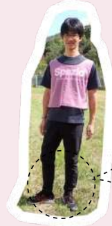
足の内側で蹴る動き (インサイドキック)