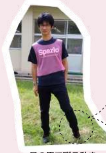
足の甲で蹴る動き (インステップキック)