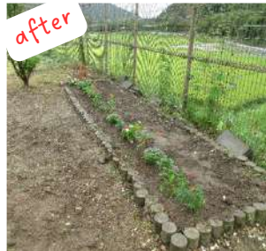
after 草抜き・耕作・整地をして花の苗の植え付け。