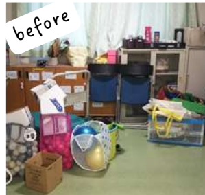
before 物品が乱雑で整理整頓できていない。