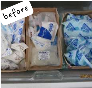
before 凍っているものも凍っていないものもバラバラに収納されていた。