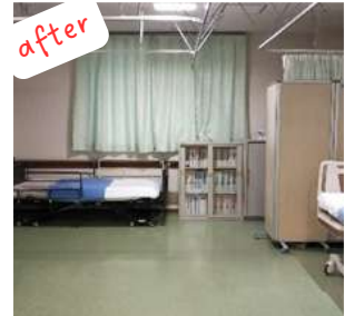
after 実施者を定めて毎日物品の整理。