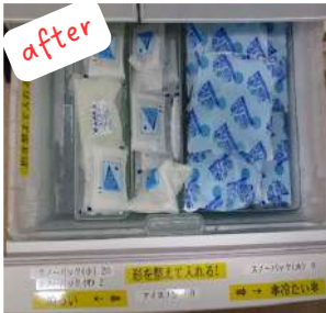
after 保冷剤の数、使用後の置き場所を明記し凍っているものが一目でわかるように！

Point 使用したいときにすぐに取り出せる。月に一度物品数の確認、整理整頓を実施！