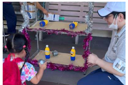
ハピネスさつま タコ焼きにフランクフルト、焼きそばの屋台、くじ引きやパン工房さくらのパンやクッキーなどたくさんのお店が出ていて、大賑わい。