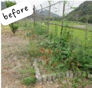
before 入口横の花壇が生い茂り寂しい状況。