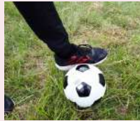
足の内側で蹴る動き (インサイドキック)